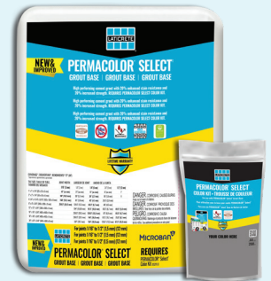
Data Sheet 281.0