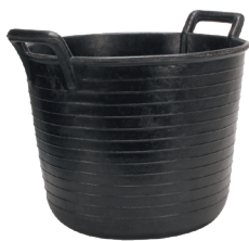
AUGE CAOUTCHOUC N°99 (33 L) REF.88804