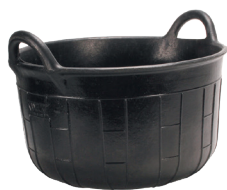
AUGE CAOUTCHOUCN°1 (26 L) REF.88902