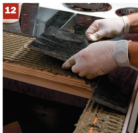
12. Posez les carreaux. Si votre plan est exact et si toutes les pièces ont été coupées à l'avance, cela se fera très vite.