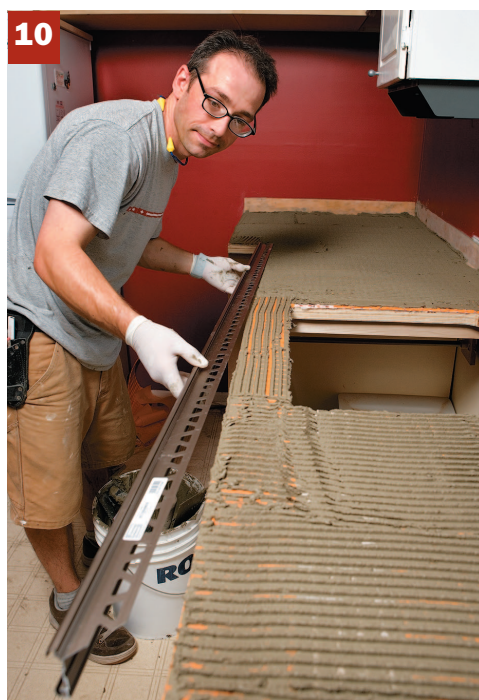
10. Installez les cornières en les pressant contre le mortier afin d'y enfoncer les ailes perforées.