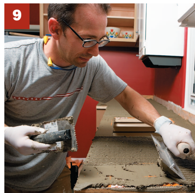
9. Étalez tout d'abord une fine couche de mortier avec le côté plat de la truelle, puis repassez avec la partie dentée. Ici, les carreaux ont 12 po de côté et on a utilisé une truelle de 3/8 po.

8. Avant de vous attaquer au carrelage, vous feriez bien de vérifier encore une fois le plan des cornières. Il n'est pas nécessaire d'attendre que le mortier de la natte ait durci pour vous mettre à l'ouvrage. Le ciment-colle des carreaux est appliqué uniformément en couche mince. Il doit être adapté au genre de carreaux que vous installez. Voyez ce qu'il en est avec le fabricant ou auprès de Schlüter si vous avez le moindre doute.