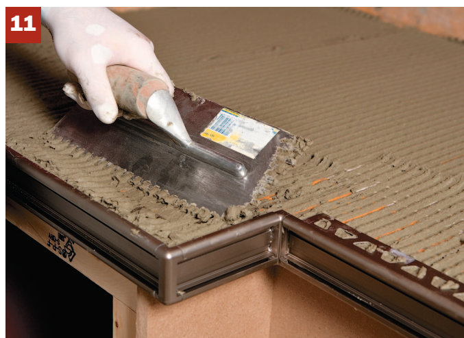
11. Étalez un peu plus de mortier sur les ailes pour que les carreaux adhèrent parfaitement aux cornières.

8. Avant de vous attaquer au carrelage, vous feriez bien de vérifier encore une fois le plan des cornières. Il n'est pas nécessaire d'attendre que le mortier de la natte ait durci pour vous mettre à l'ouvrage. Le ciment-colle des carreaux est appliqué uniformément en couche mince. Il doit être adapté au genre de carreaux que vous installez. Voyez ce qu'il en est avec le fabricant ou auprès de Schlüter si vous avez le moindre doute.