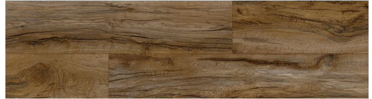
Wild West Dawn