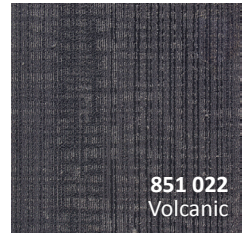
851 022 Volcanic