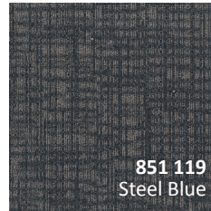
851 119 Steel Blue