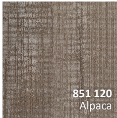
851 120 Alpaca