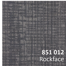
851 012 Rockface