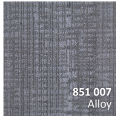
851 007 Alloy