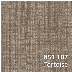
851 107 Tortoise