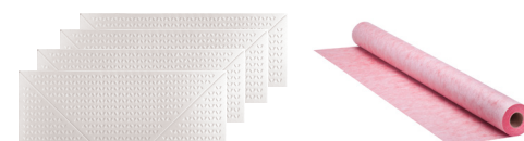
PROVA UNIVERSAL EXTENSION KIT®