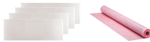
PROVA UNIVERSAL EXTENSION KIT®