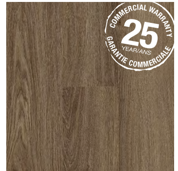
Enigma | Énigme 6453