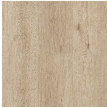
Veiled | Voilé 6401