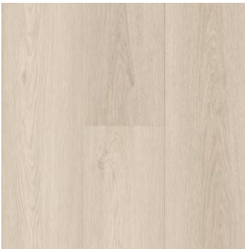
Lucent | Lucent 6450