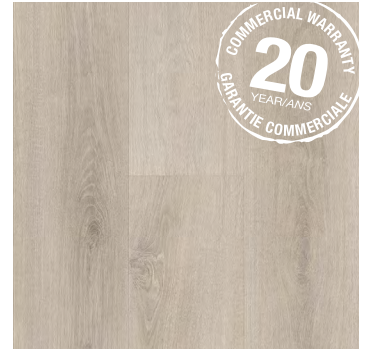
Luminous | Lumineux 6403