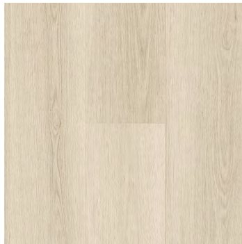
Hushed | Silencieux 6451