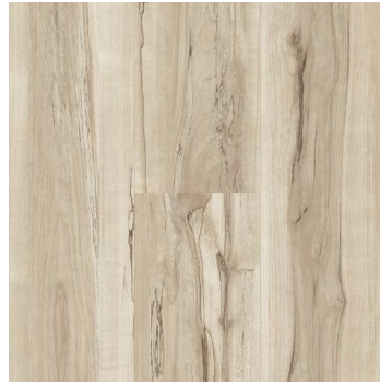
Eloquent | Éloquent 6402