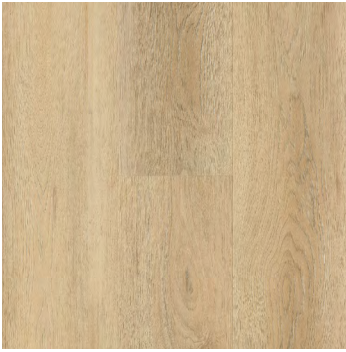
Enchanted | Enchanté 6400