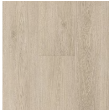
Harmony | Harmonie 6452