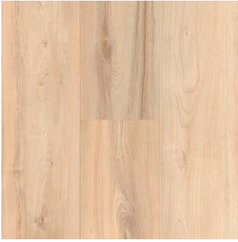
Brassy Maple | Érable Brassy 6484 5mm x 7.24" x 48"