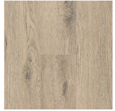
Sylva Oak | Chêne Sylva 6483 5mm x 7.24" x 48"