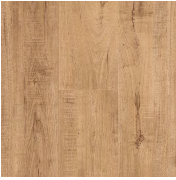
Umberface Oak | Chêne Umberface 6480 5mm x 7.24" x 48"