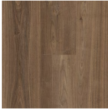
Shadowgrain Oak | Chêne Shadowgrain 6481 5mm x 7.24" x 48"