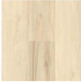
Mooncast Maple | Érable Mooncast 6485 5mm x 7.24" x 48"