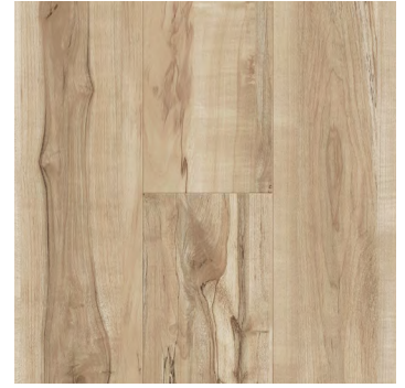
Mistwood Maple | Érable Mistwood 6487 5mm x 7.24" x 48"