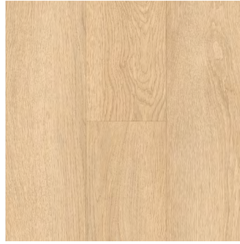
Honeywisp Oak | Chêne Honeywisp 6486 5mm x 7.24" x 48"