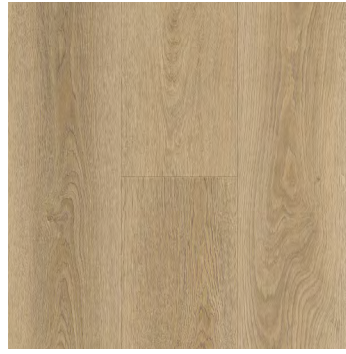
Sepiadrift Oak | Chêne Sepiadrift 6482 5mm x 7.24" x 48"