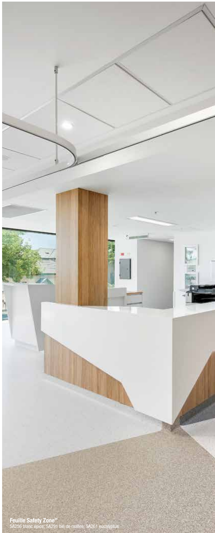
Feuille Safety Zone MC 5A256 blanc épice; 5A291 blé de mallee; 5A261 eucalyptus

de garantie totale en utilisant les produits de préparation de planchers bruts Strong System MC .