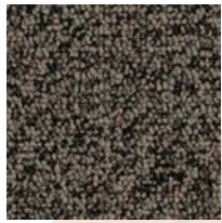
#76388 Ambre romaine