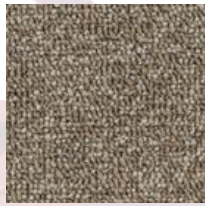
#16320 Beige de pampa