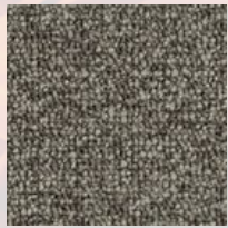
#89811 Nuage de grêle