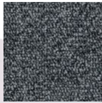
#89819 Ciel majestueux