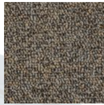
#89809 Désert chinois