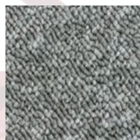
#84175 Gris brume