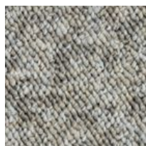
#89834 Brouillard sur la ville