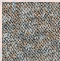
#79734 Mélodie du désert