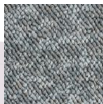
#89821 Gris de manchester