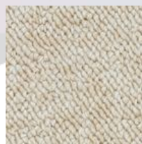
#19513 V. pâle/moka pâle