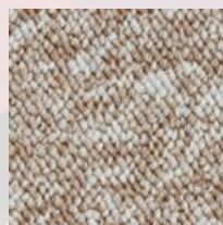
#79497 Saison de l'érable