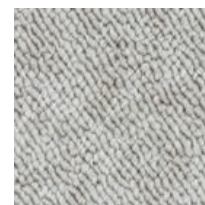
#86590 Laine rustique