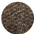
Couleur: Beige Code: PN60315