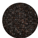
Couleur: Chocolate Code: PN60310