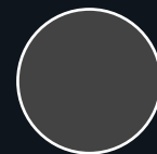
Couleur: Black Format: 50' Code: UF1-BK