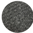
Couleur: Grey Code: PN60325