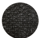
Couleur: Charcoal Code: PN60320