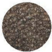
Couleur: Beige Code: PN60315