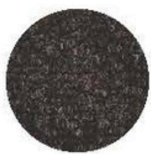
Couleur: Chocolate Code: PN60310