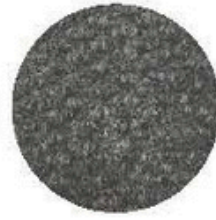
Couleur: Grey Code: PN60325