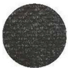
Couleur: Charcoal Code PN60320