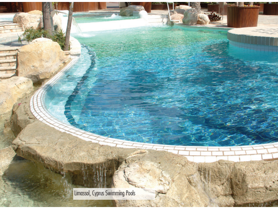
Limassol, Cyprus Swimming Pools

Latex based waterproofing/anti-fracture membrane