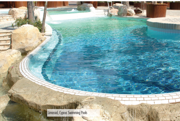
Limassol, Cyprus Swimming Pools

Membrane d'étanchéité/antifracture à base de latex