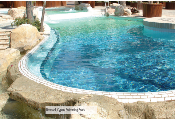
Limassol, Cyprus Swimming Pools

Membrana impermeabilizante y antifisuras a base de látex