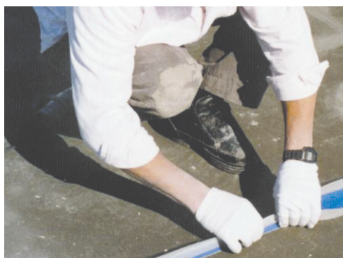
Exemple d'imperméabilisation d'un joint de structure sur une terrasse