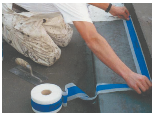
Exemple d'utilisation de Mapeband pour l'imperméabilisation d'un coin situé entre le bas et le côté d'une baignoire