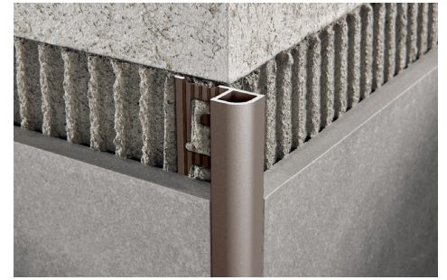
ALUMINIUM LAQUÉ thermo packed - longueur b. 2,7 M cond. 20 Pcs-54 ML (couleur blanc 40 Pcs-108 ML)

D'AUTRES FINITIONS DE LA GAMME COULEURS PEUVENT ÊTRE RÉALISÉES SUR DEMANDE. CONTACTER LE BUREAU COMMERCIAL POUR LES QUANTITÉS MINIMALES, DÉLAIS ET COÛTS.