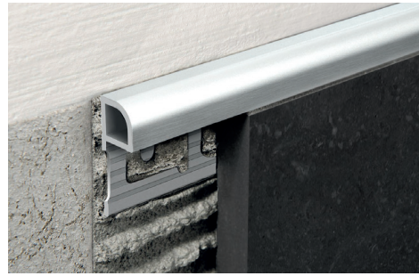
ALUMINIUM BROSSÉ (ARGENT) thermo packed - longueur b. 2,7 ML - cond. 40 Pcs - 108 ML (H 12,5 mm, 15 mm - cond. 20 Pcs)

1. Choisir le PROJOLLY QUART en fonction de l'épaisseur du carreau et de la finition souhaitée; 2. Couper PROJOLLY QUART à la longueur souhaitée et appliquer la colle sur le support où sera posé le profilé; 3. Presser l'ailette de fixation de PROJOLLY QUART sur la colle; 4. Poser les carreaux en prenant soin de les aligner au profilé et de laisser un joint de 2 millimètres environ. Enlever immédiatement les résidus de colle de la surface du profilé; 5. Mastiquer soigneusement les joints entre le profilé et le carreau pour éviter la stagnation éventuelle d'eau. Enlever immédiatement les résidus d'enduit de la surface du profilé.