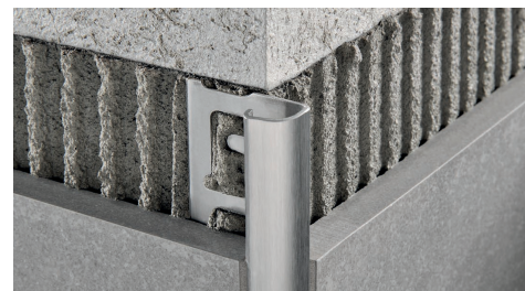
ACIER INOX AISI 304/1.4301-V2A SATINÉ avec film de protection longueur b. 2,7 ML - cond. 20 Pcs - 54 ML (H 4,5 mm - 108 ML) - 10/10 mm