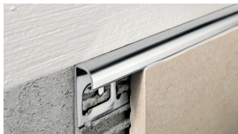
ACIER INOX AISI 304/1.4301-V2A POLI avec film de protection longueur b. 2,7 ML - cond. 20 Pcs - 54 ML (H 4,5 mm - 108 ML) - 10/10 mm